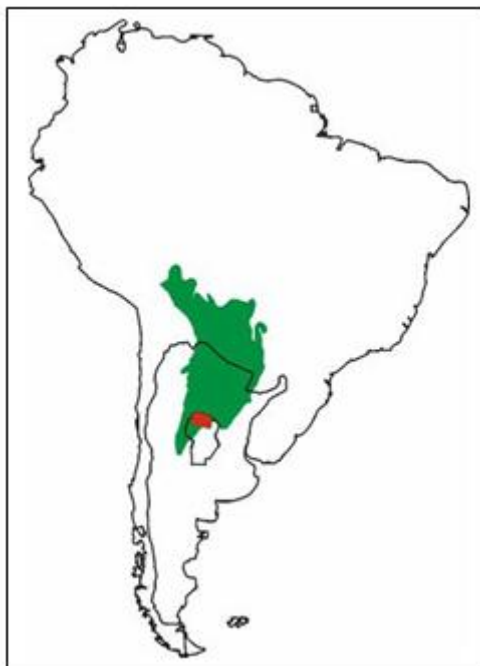
Figura 1: Localización geográfica del bosque chaqueño

El área de estudio se ubica al Norte de la provincia de Córdoba, siendo parte de un sistema más extenso que ocupa una vasta superficie del corazón de América del Sur, comprendiendo territorios de Brasil, Paraguay, Bolivia y Argentina. Se trata de la región de la llanura chaqueña y sus bosques, los de mayor importancia forestal después de la Amazonia. (Ver Figura 1 donde se localiza el bosque chaqueño y el área de estudio)