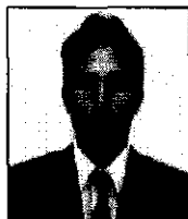
Ingeniero Industrial de la UNMSM, estudios de maestría en Gestión Económica Empresarial y Proyectos de Inversión. Docente en la Unidad de Gestión de la Facultad de Ing. Industrial.

“La productividad es la utilización eficiente y eficaz de todos los recursos productivos que nos indica el nivel de la salud productiva de la empresa”